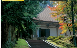
中尊寺・金色堂(平泉町)