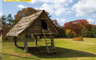
御所野遺跡(一戸町)